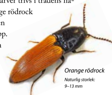
Orange rödbeck Naturlig storlek: 9-13 mm

Flera ovanliga skalbaggar påträffats i reservatet. Den sällsynta ädelguldbaggens larver trivs i trädens håligheter. Larver av orange rödbeck lever i död ved som solen kommer åt att värma upp. En verklig raritet är den tiofläckiga vedsvampbaggen, som håller till i de tickor som växer på gamla trädstammar.