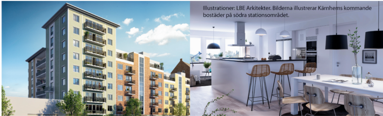
Illustrationer: LBE Arkitekter. Bilderna illustrerar Kärnhems kommande bostäder på södra stationsområdet.