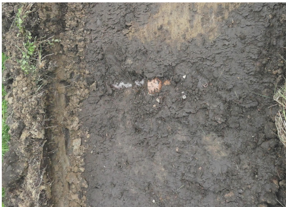
Figur 2. Äldre avloppsledning i Höganäskeramik.

De anläggningar som mätts in utgörs i huvudsak av sentida uppgrusningar och ledningsschakt. Öster om diponentsvillan påträffades en äldre avloppsledning av Höganäskeramik.