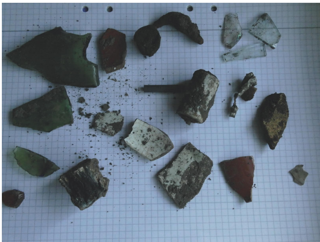
Figur 3. Urval av fyndmaterial. Den påträffade flintan syns i bildens högra, nedre del. Inga fynd har sparats.

I det sydligaste schaktet, väster om bastun påträffades en bit flinta, ca 20 centimeter under markytan. På samma nivå och längre ner påträffades recent material vilket tyder på att området är stort av sentida påverkan. Möjligen har området delvis fyllts ut och det är därmed svårt att förklara varifrån flintan ursprungligen kommer. Inga andra fynd av förhistorisk karaktär påträffades vid grävningen.